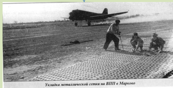
Укладка металлической сетки на ВПП в Марково